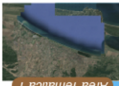
Area Tematica 1

Litorale compreso tra Ansedonia e la foce del Fiume Fiora Monitoraggio degli effetti delle attività di ripascimento costiero nella zona sud di Ansedonia Rilievi per il monitoraggio dell'evoluzione della linea di riva, della morfologia del fondale e della sedimentologia. Monitoraggio dello stato attuale della spiaggia in relazione agli interventi di ricostruzione e difesa e valutazione dell'impatto delle opere costiere realizzate. Valutazione dell'efficacia dei recenti interventi di ripristino del profilo morfodinamico delle spiagge di Capalbio e programmazione di eventuali interventi di manutenzione da attuare in futuro.