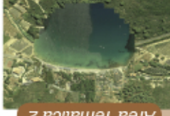
Area Tematica 2

Spiaggia di Lacona, Isola d'Elba Ripristino e conservazione del sistema duna-spiaggia di Lacona (Isola d'Elba) Monitoraggio dello stato della spiaggia e della duna che costituisce l'unico sistema dunale presente nell'Arcipelago Toscano. La duna è minacciata sia da mare, per un'erosione modesta ma costante della spiaggia, sia da terra, per l'elevata frequentazione nel periodo estivo. Buone pratiche per la gestione dei sedimenti costieri all'interno del golfo di Lacona.