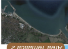
Area Tematica 2

Litorale compreso tra la foce del Fiume Magra e il porto di Marina di Carrara Riutilizzo dei sedimenti alluvionali estratti dal Magra per il ripascimento dei litorali Definizione di un protocollo per la gestione integrata del bacino idrografico e della costa. Misure per il riutilizzo dei sedimenti alluvionali (sabbia e ghiaia) estratti dal tratto terminale del fiume Magra, che si sono resi disponibili dopo i recenti fenomeni alluvionali. Valutazione della compatibilità sedimentologica e chimico-fisica dei sedimenti estratti. Valutazione dell'efficacia delle opere di difesa costiere realizzate in passato.