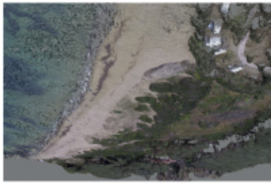
Ricostruzione tridimensionale della spiaggia di Lacona (Isola d'Elba) grazie alle immagini acquisite dal drone.

Spiaggia di Lacona, Isola d'Elba Ripristino e conservazione del sistema duna-spiaggia di Lacona (Isola d'Elba) Monitoraggio dello stato della spiaggia e della duna che costituisce l'unico sistema dunale presente nell'Arcipelago Toscano. La duna è minacciata sia da mare, per un'erosione modesta ma costante della spiaggia, sia da terra, per l'elevata frequentazione nel periodo estivo. Buone pratiche per la gestione dei sedimenti costieri all'interno del golfo di Lacona.