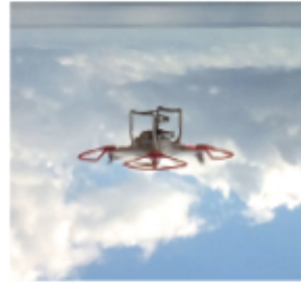
Drone in volo sulla spiaggia di Lacona (Isola d'Elba) per acquisire immagini.