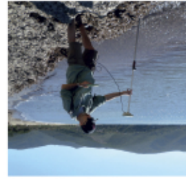
Misure con GPS RTK unit alla ridifrizione della linea di riva. Spiaggia di Lacona.

RILIEVI E ANALISI I numerosi rilievi realizzati sulle aree pilota toscane hanno permesso di acquisire dati importanti sulla dinamica costiera e sul budget dei sedimenti. Le attività sono svolte in collaborazione tra Regione Toscana, Consorzio LaMMA, Dipartimento di Scienze della Terra dell'Università di Firenze. I rilievi sono stati realizzati da GeoCoast.